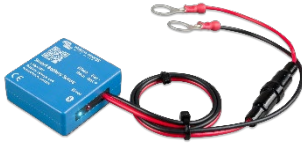
Bluetooth tespiti Akıllı Akü Hassasiyeti