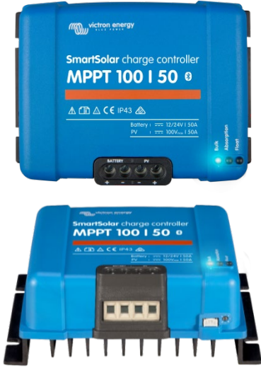
SmartSolar Şarj Kontrol Birimi MPPT 100/50