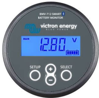
Bluetooth tespiti BMV-712 Smart Akü Monitörü